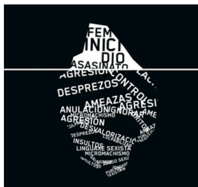
imaxe da campaña Compostela en negro